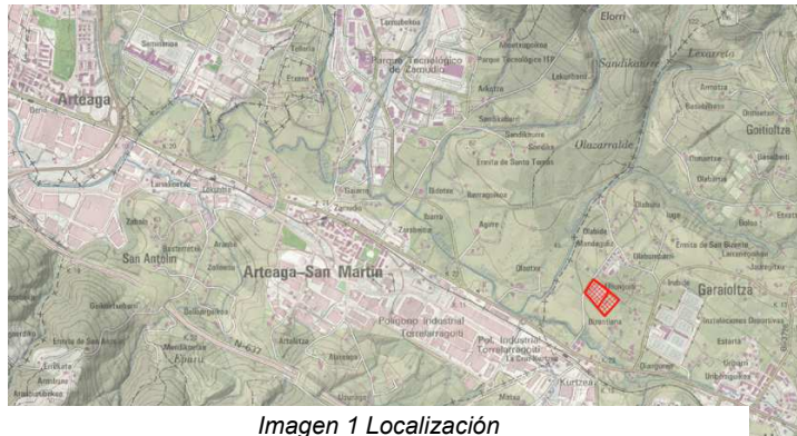
Imagen 1 Localización

El ámbito de la modificación se encuentra en la cuenca del río Asua, en la margen izquierda del arroyo Basobaltza y en la margen derecha del río Asua, dentro del ámbito de gestión de las cuencas intracomunitarias de la Demarcación Hidrográfica del Cantábrico Oriental.